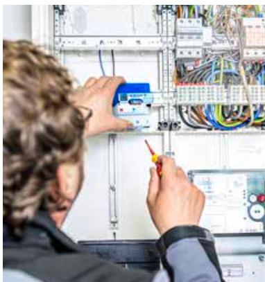
Mit einem Smart Meter können Haushalte ihren Energieverbrauch genauer nachvollziehen.

AB 2025 sind Haushalte von 6.000 bis 100.000 Kilowattstunden (kWh) Stromverbrauch pro Jahr zum Einbau von intelligenten Messsystemen, sogenannten Smart Metern, verpflichtet. In diese Kategorie fallen zum Beispiel größere Privathaushalte mit mehr als fünf Personen. Die meisten Haushalte liegen jedoch unter einem Jahresverbrauch von 6.000 kWh: Für sie bleibt der Einbau optional. Ebenfalls in der Pflicht ist, wer eine Photovoltaikanlage von sieben bis 100 Kilowatt installierter Leistung, eine Wärmepumpe oder eine Wallbox zum Laden des Elektroautos nutzt. Mit dem Smart Meter haben Verbraucher ihren Energiekonsum präziser im Blick.