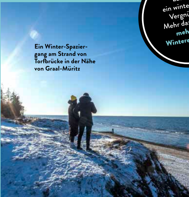
Ein Winter-Spaziergang am Strand von Torfbrücke in der Nähe von Graal-Müritz

Lust auf ein winterliches Vergnügen? Mehr dazu unter: mehr.fyi/ Wintererlebnisse