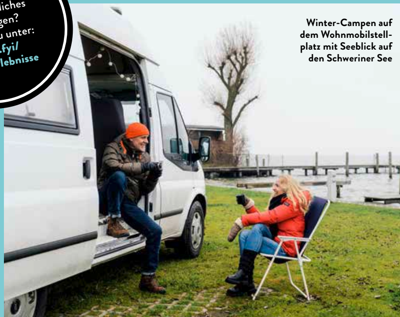
Winter-Campen auf dem Wohnmobilstellplatz mit Seeblick auf den Schweriner See

Lust auf ein winterliches Vergnügen? Mehr dazu unter: mehr.fyi/ Wintererlebnisse